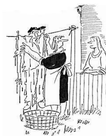
"It saves time, he's never out of them!"